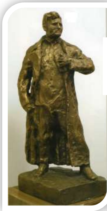
2002нче елда Муса Жәлилнең һәйкәлен бронзадан ясый